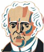
Charles Fourier (1772 – 1837)